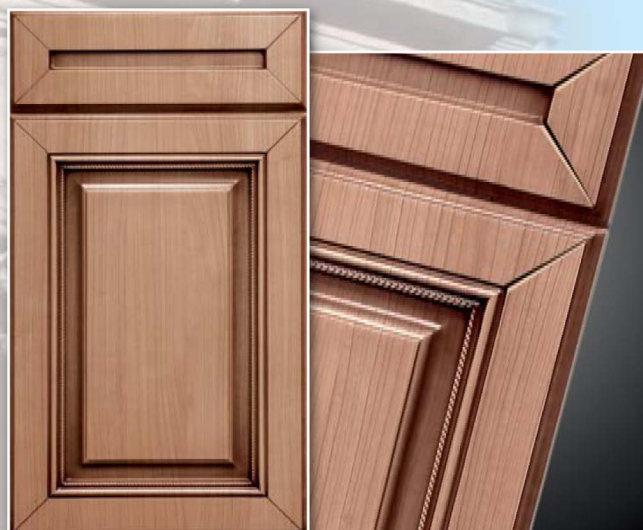
2-Сицилия, Портофино, патина