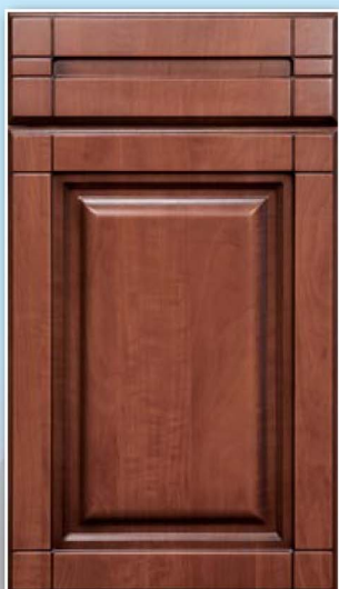
0-Корсика, Дикая яблоня, патина