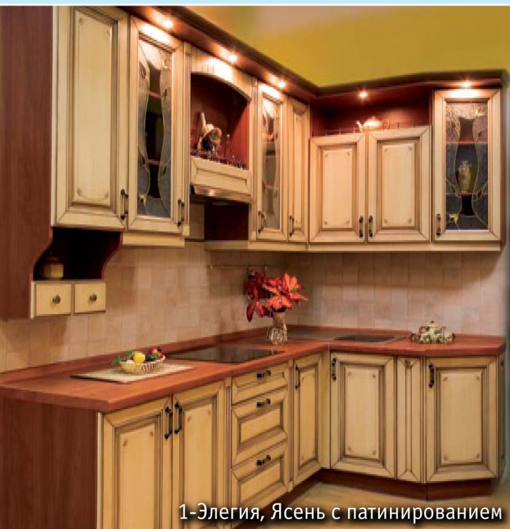
1-Элегия, Ясень с патинированием