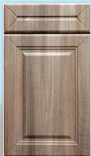
0-Сицилия, Тик серый