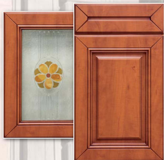
2-Сицилия, Груша, патина