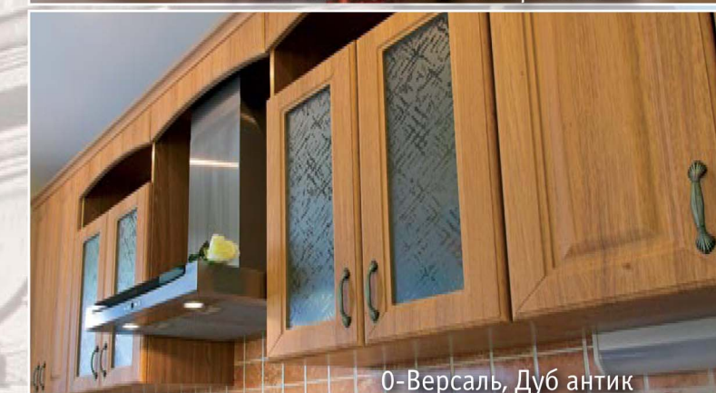
0-Версаль, Дуб антик