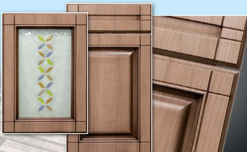
1-Корсика, Вишня портофино, патина