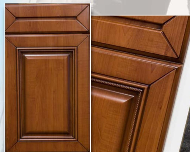
2-Версаль, Манхеттен, патина