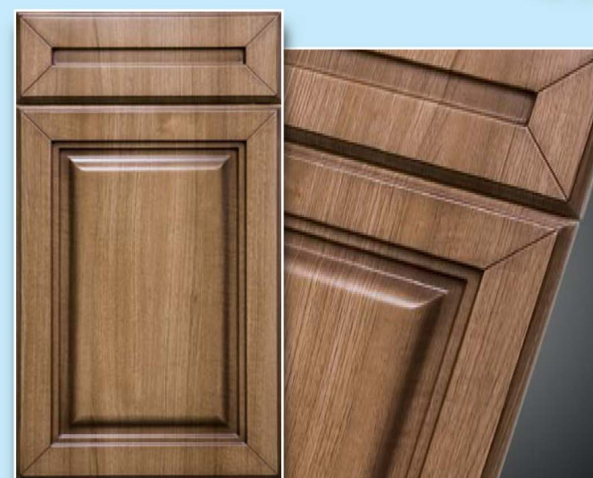
0-Версаль, Тик, патина