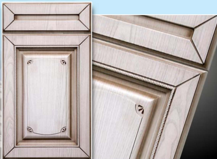
1-Элегия, Орегон, патинирование