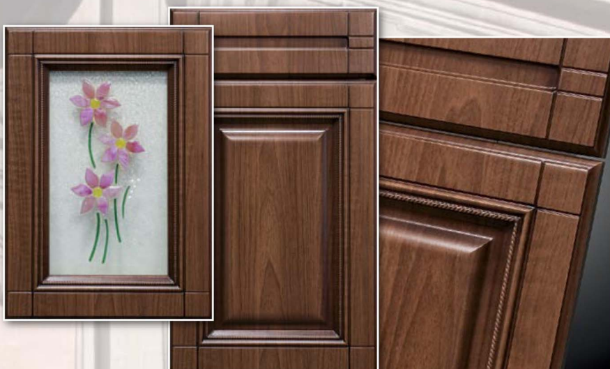
2-Корсика, Темный орех, патина