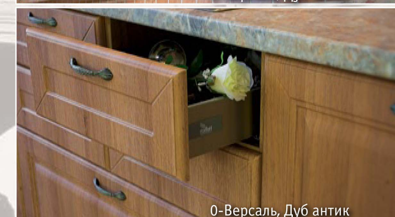
0-Версаль, Дуб антик