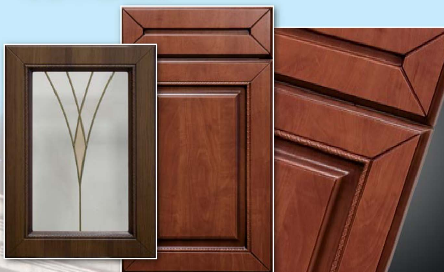
1-Сицилия, Дикая яблоня, патина