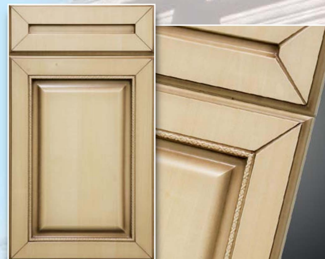
1-Версаль, Ясень, патина